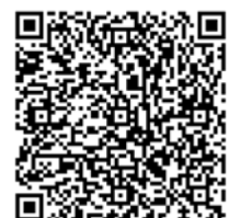
"San Francisco 78" Créa d'Aulnay sous Bois